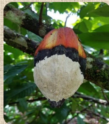
Figura 4. Afectaciones por monilia en cacao