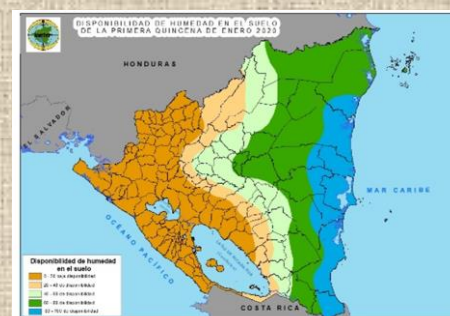
Mapa 2. Disponibilidad de humedad en el suelo en la primera quincena de enero 2020