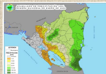
Mapa 1. Acumulado de precipitación en la primera quincena de enero 2020

En la primera decena se registraron valores poco significativos por estrés agrícola en los cultivos de apante con valores entre 10 % y 25 % en los municipios de Quilalí, Santa María de Pantasma, Waslala y El Castillo. (Ver mapa 3).