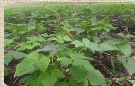
Figura 1. Cultivo de frijol de apante en estado fenológico vegetativo

En los bosques de coníferas se identificaron focos con afectaciones por el gorgojo descortezador en los municipios de Macuelizo, Dipilto y San Rafael del Norte.