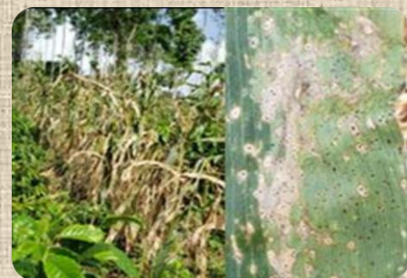
Figura 2. Afectaciones por mancha de asfalto en el cultivo de maíz