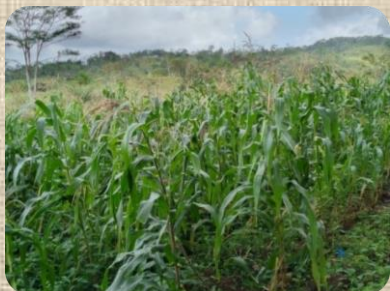
Boletín quincenal N° 9

En los próximos días, se espera que se mantengan las condiciones de fuertes vientos, que podrían afectar los cultivos