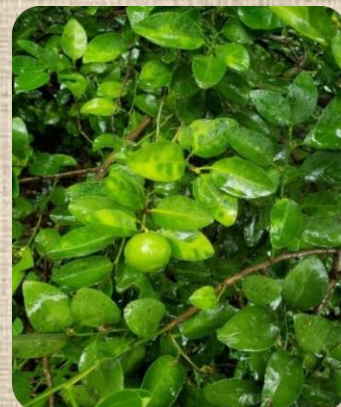
Figura 3. Afectaciones por la bacteria Huanglongbing en arboles de cítricos